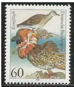
13. Kemphaan en hen

Veel vogels krijgen in het voorjaar speciale verenpatronen en versieringen (kuiven, pluimen en lellen) om het baltsgedrag kracht bij te zetten. Reigers krijgen pluimen en futen en Kemphanen (13) beschikken in het voorjaar over verschillende versieringen om mee te pronken. De mannetjes van de Rietgors (14) hebben een groot deel van het jaar een eenvoudig bruin verenkleed. In het broedseizoen echter hebben ze een opvallende koptekening. Ze hebben een duidelijke zwarte keelvlek, wangen en voorhoofd. De Papegaaiduiker- man (15) krijgt op de snavel levendige rode, gele en blauwe kleuren tijdens het broedseizoen. Sommige vogels krijgen aan het begin van de winter een wit verenkleed zoals de sneeuwhoenders (16). De verkleuringen ontstaan door de kortere of langere daglengte tijdens het jaar.