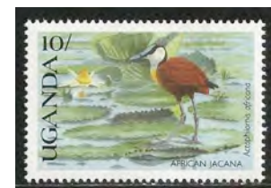
10. Vrouwtje Afrikaanse Jacana

Bij sommige soorten (9-10) zijn het juist de vrouwtjes die opvallend gekleurd zijn. Zij laten het broeden en opvoeden van de jongen aan de mannetjes over.