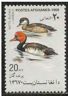
2. Krooneenden paar

Als mannetjes en vrouwtjes, zoals bij eenden (2), duidelijk verschillen spreekt men van seksuele dimorfie. Lichaamskenmerken van seksuele dimorfie zijn grootte, kleur, snavel en vleugels. Vogels die broeden en jongen moeten grootbrengen vallen extra gemakkelijk aan roofdieren ten prooi. Daarom hebben de vrouwtjes van soorten waarbij deze taken geheel door het vrouwtje worden uitgevoerd, door natuurlijke selectie vaak een onopvallend uiterlijk ontwikkeld. De mannetjes hebben opvallende kenmerken die de herkenning door de vrouwtjes vergemakkelijken. De vleugelspiegel (3-4) van de mannetjes en vrouwtjes is bij eenden altijd een herkenningsteken voor soortgenoten. De vleugelspiegel wordt gevormd door de kleine slagpennen (armpennen).