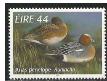
17. paartje Smienten

Het verenkleed van vele mannetjes eenden is bijna permanent veel kleuriger dan de vrouwtjes zijn eenvoudiger gekleurd. De mannetjes (17) houden hun prachtkleed de hele winter tot in de zomer. Vanaf midden zomer tot in de herfst ruilen de eenden. De mannetjes krijgen tijdelijk een op het wijfje lijkend eclipskleed. Tijdens deze periode kunnen eenden niet vliegen en zijn ze kwetsbaar. Dit zijn voorbeelden van seizoen dimorfie.