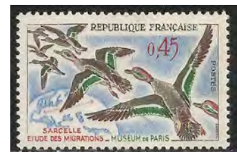
4. De vleugelspiegel van de Wintertaling is zwart-groen.