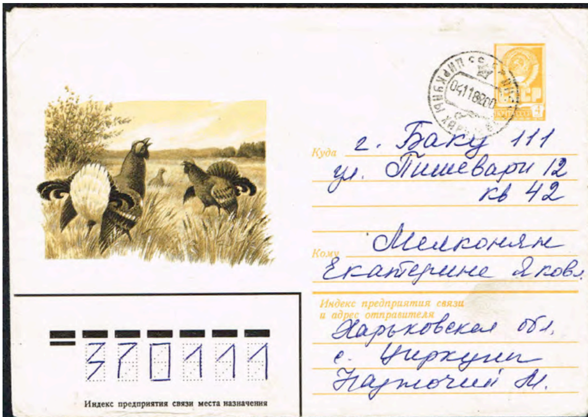
Twee baltsende Korhanen, een hen kijkt belangstellend toe