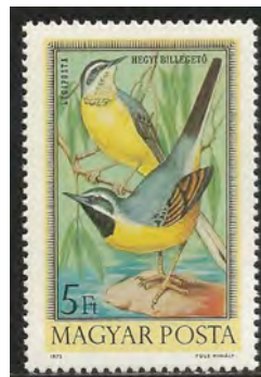
Grote Gele Kwikstaart, mannetje met zwarte keelvlak.