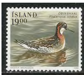
9. Vrouwtje Rosse Franjepoot

Bij sommige soorten (9-10) zijn het juist de vrouwtjes die opvallend gekleurd zijn. Zij laten het broeden en opvoeden van de jongen aan de mannetjes over.