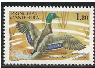
3. De vleugelspiegel van de Wilde Eend is blauw.

Als mannetjes en vrouwtjes, zoals bij eenden (2), duidelijk verschillen spreekt men van seksuele dimorfie. Lichaamskenmerken van seksuele dimorfie zijn grootte, kleur, snavel en vleugels. Vogels die broeden en jongen moeten grootbrengen vallen extra gemakkelijk aan roofdieren ten prooi. Daarom hebben de vrouwtjes van soorten waarbij deze taken geheel door het vrouwtje worden uitgevoerd, door natuurlijke selectie vaak een onopvallend uiterlijk ontwikkeld. De mannetjes hebben opvallende kenmerken die de herkenning door de vrouwtjes vergemakkelijken. De vleugelspiegel (3-4) van de mannetjes en vrouwtjes is bij eenden altijd een herkenningsteken voor soortgenoten. De vleugelspiegel wordt gevormd door de kleine slagpennen (armpennen).