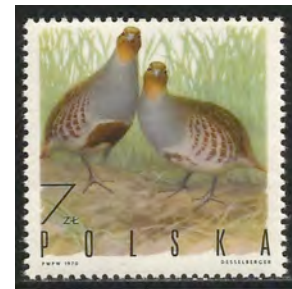
Patrijs, roodbruine hoefijzervlek van mannetje.