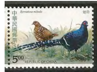
6. Mikado fazant

In sommige gevallen, zoals bij roofvogels, is er een duidelijk verschil in grootte, waarbij de mannetjes bijna altijd kleiner zijn (5). Bij de fazanten (6) zijn de hanen echter groter en hebben een veel opvallender verenkleed dan de hennen. Bij sommige soorten spechten hebben de mannetjes en de vrouwtjes verschillende snavels in lengte en vorm.