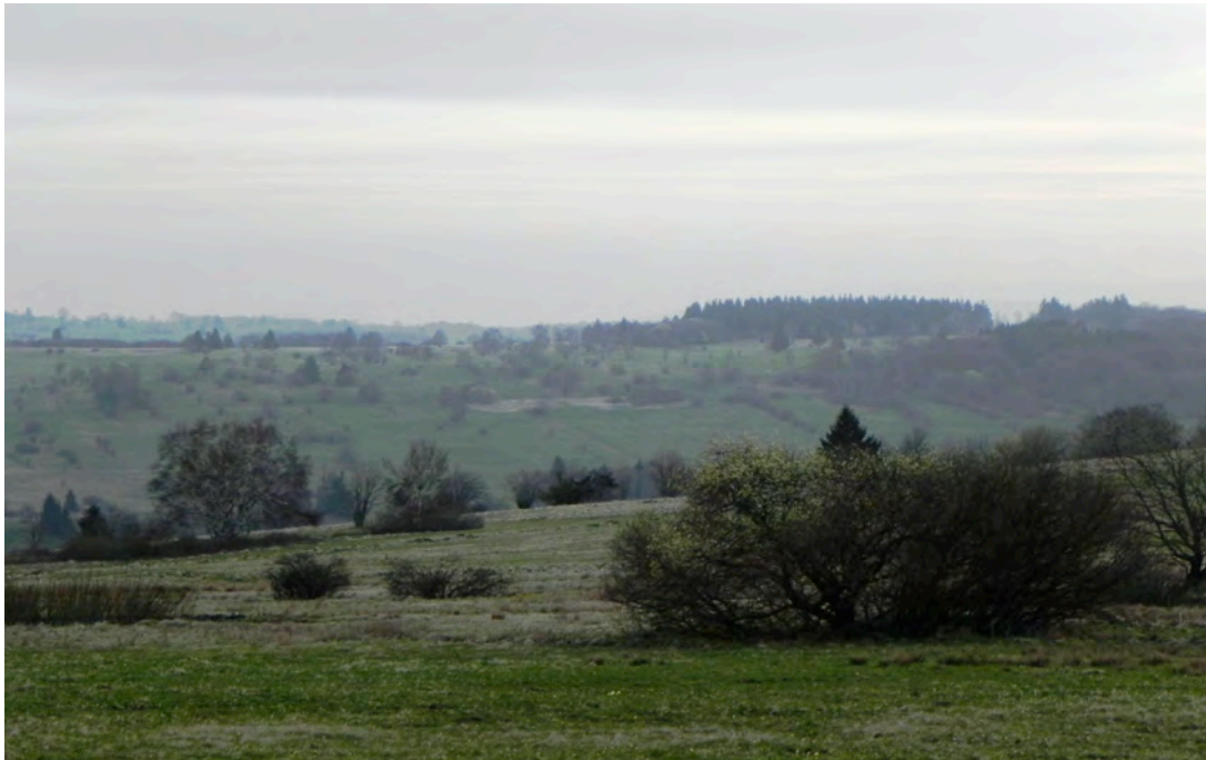
Op zoek naar Korhoenders

Rond 16.00 uur zijn de meeste deelnemers aangekomen en ontmoeten we elkaar in de tuin. In het zonnetje worden de laatste nieuwtjes uitgewisseld en worden 'oude' banden aangehaald. Na het lopend buffet- diner om 18.30 uur volgt het traditionele Tausch und Plausch. Vanwege de weersverwachting (sneeuw en hagel in het weekend) zal het programma van de dagen worden omgegooid. Zo wordt vrijdag de dag voor de vogelaars, met twee excursies en een natuur-lezing. Zaterdag zal er dan vooral aandacht zijn voor de filatelistische aspecten van onze hobby en voor de jaarvergadering.