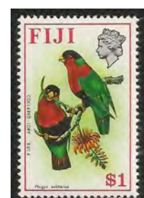
12. Gekraagde Lori paartje ?

mede afhing van het gedrag, monogaam dan wel polygaam. Om dat vermoeden te testen, onderzochten ze soorten aan de hand van de kleurigheid van het