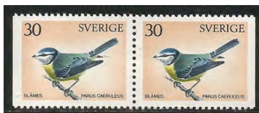
11. Pimpelmees, man, vrouw of paar?

Gedragsecologen dachten lange tijd dat de mate van seksuele dimorfie