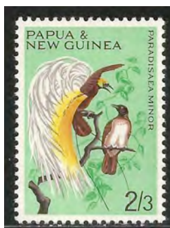
Paartje Kleine Paradijsvogels