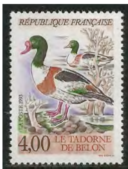
Bergeend, rode knobbel op de snavel van het mannetje.

Er zijn soorten waarbij de seksuele dimorfie minder duidelijk is.