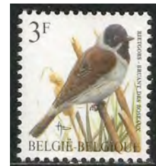
14. Rietgors man

Veel vogels krijgen in het voorjaar speciale verenpatronen en versieringen (kuiven, pluimen en lellen) om het baltsgedrag kracht bij te zetten. Reigers krijgen pluimen en futen en Kemphanen (13) beschikken in het voorjaar over verschillende versieringen om mee te pronken. De mannetjes van de Rietgors (14) hebben een groot deel van het jaar een eenvoudig bruin verenkleed. In het broedseizoen echter hebben ze een opvallende koptekening. Ze hebben een duidelijke zwarte keelvlek, wangen en voorhoofd. De Papegaaiduiker- man (15) krijgt op de snavel levendige rode, gele en blauwe kleuren tijdens het broedseizoen. Sommige vogels krijgen aan het begin van de winter een wit verenkleed zoals de sneeuwhoenders (16). De verkleuringen ontstaan door de kortere of langere daglengte tijdens het jaar.