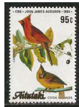
Paartje Rode Kardinalen

Voorbeelden van duidelijke seksuele dimorfie