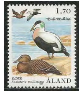
1. Eiderend, mannetje en vrouwtje.

Dimorfie is het verschijnsel dat binnen een zelfde soort twee groepen van individuen voorkomen die zich in bepaalde kenmerken van elkaar onderscheiden. In verreweg de meeste gevallen berust dit op het verschil tussen de geslachten, seksuele dimorfie. Het betreft hier niet de geslachtsorganen zelf, maar de morfologische verschillen in lichaamsvorm, lichaamsgrootte of lichaamskleur (1).