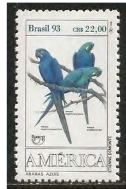
12. Hyacinth ara, mannetjes en/of vrouwtjes?

verenpak, zoals dat door de mens wordt waargenomen. Inmiddels weten we dat dit naïef is. Vogels zien anders dan wij, omdat ze ultraviolet licht kunnen waarnemen. Als je onder ultraviolet licht naar vogels kijkt, blijkt dat bij veel soorten, waaronder de Pimpelmees (11) en diverse papegaaien (12), aanzienlijke verschillen waarneembaar zijn tussen mannetjes en vrouwtjes. Er is dus sprake van seksuele dimorfie. Dat zie je pas met ogen die ultraviolet licht kunnen waarnemen, zoals vogels.