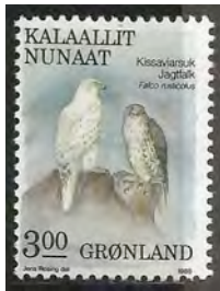
5. Giervalk, mannetje en vrouwtje

In sommige gevallen, zoals bij roofvogels, is er een duidelijk verschil in grootte, waarbij de mannetjes bijna altijd kleiner zijn (5). Bij de fazanten (6) zijn de hanen echter groter en hebben een veel opvallender verenkleed dan de hennen. Bij sommige soorten spechten hebben de mannetjes en de vrouwtjes verschillende snavels in lengte en vorm.