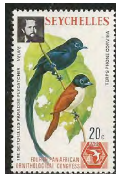
Paartje Seychellen Paradijsvliegenvanger