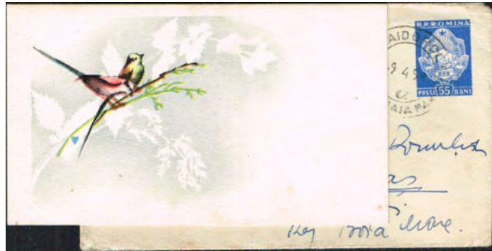
Afb. 6: Roemeense envelop met ingedrukt zegel van 55 Bani die samen met het kaartje door de Roemeense Posterijen verkocht werd voor 1 Leu

Beide partners bouwen gezamenlijk in 2 tot 3 weken een zeer solide, bolvormig of eigenlijk meer eivormig nest van mos, haar, dons en veertjes, bij elkaar gehouden door spinrag en bekleed met boomschors en korstmos. Daardoor valt het nauwelijks op. Wat wél opvalt is, dat ze vaak enorme hoeveelheden veertjes (Afb. 7) weten te vinden om hun nest te stofferen, dat kan in de