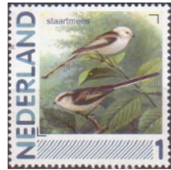
Afb. 1: persoonlijke postzegel

Nu de bladeren van de bomen zijn, kunnen we ze weer geregeld tegenkomen. Ook al zijn ze algemeen in ons land volgens Vogelbescherming Nederland, een beetje geluk moet je er wel voor hebben. Ze leven vooral in het buitengebied waardoor je ze niet zo vaak te zien krijgt en bovendien kijk je er gemakkelijk overheen, want ze zijn klein, erg klein: Staartmezen. Een van onze kleinste vogeltjes, die weliswaar van snavelpunt tot staartpunt veertien centimeter meet, maar daarvan is méér dan de helft staart en de rest is niet meer dan een donsballetje (Afb. 1). Bij elkaar ongeveer 8 gram, hoewel dat soms een grammetje meer of minder kan zijn. Schuw zijn ze allerminst, ze kunnen zeer dicht benaderd worden.