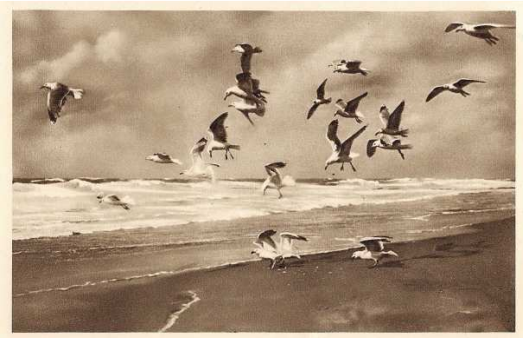
Afb. 9 Sonderkarte für das Winterhilfswerk

Het zijn echte alleseters; langs de kust (Afb. 9) staan krabben, zeesterren en vissen op hun menu. Ook regenwormen, insecten en schelpdieren worden gegeten, mosselen bijvoorbeeld. Ze laten de schelpen op een harde ondergrond vallen zodat de inhoud gegeten kan worden. Jonge vogels moeten dit nog leren. Kokkels worden door trappelbewegingen losgeweekt uit het slijk en vervolgens gegeten. Deze trappelbewegingen gebruikt hij ook om regenwormen uit de grond te lokken, vaak zie je ze zo met meerdere exemplaren bij elkaar op een grasveld staan (Afb. 10).