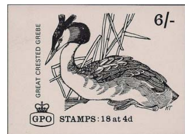
Afb.6: proefdruk van kaft PZB

mannetje en vrouwtje zien er precies hetzelfde uit, dus het had ook "zij" en "haar"