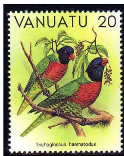
(7) Trichoglossus haematodus