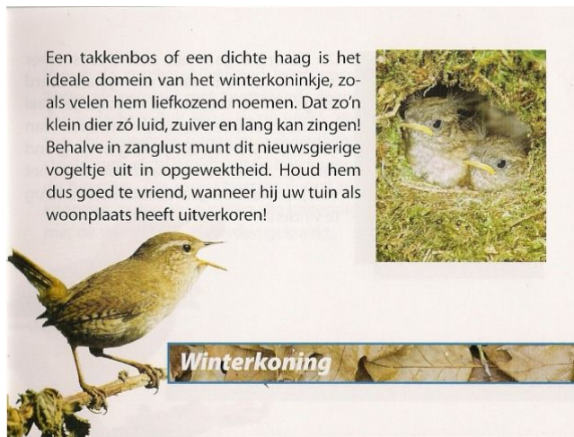
Afb. 10 (Blad uit prestigeboekje Vogelbescherming)