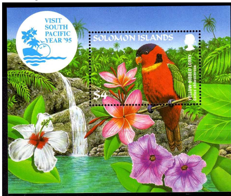
(3) Lorius chlorocercus

De grootte kan variëren van de afmetingen van een Huismus tot die van een postduif. Ze hebben, net als alle papegaaien en parkieten, twee tenen naar voren gericht en twee tenen naar achter. De vierde, buitenste teen en de eerste teen - tegenover de tweede en de derde teen staand- wijzen naar achter (zygodactiele teenplaatsing). Deze 'tang' die dient om te klimmen en om iets vast te houden. Alle soorten papegaaien en dus ook de lori's gebruiken hun snavel als een derde poot bij het klimmen. De neusgaten en de snavelwortel hebben een washuid. De bovensnavel is door het speciale gewricht beweeglijk ten opzichte van de schedel. De vijlkerven (harde dwarsbanden om de snavel te wetten) aan de onderzijde van de bovensnavel zijn bij lori's gereduceerd als gevolg van de aanpassing aan hun voeding.