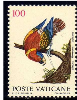
(2) Lorius domicellus

Ook landen waar lori's van nature niet voorkomen geven postzegels uit met afbeeldingen van deze vogels.