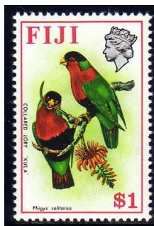
(19) Phigys solitarius

De Molukkenlori of geelmantellori, Lorius garrula , (18) is een vogel met een lengte van 28 cm. Deze lori is hoofdzakelijk rood gekleurd met uitzondering van de olijfgroene vleugels, gele vleugelboog en gele ondervleugeldekveren. De staart is aan de bovenzijde aan het begin rood, daarna donkerpaars en daarna met groen vermengd. De snavel en de ogen zijn oranje.