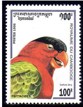
(1) Lorius lory

Lori's behoren tot de orde papegaaien, Psittaciformes en tot de onderfamilie Trichoglossinae. De onderfamilie Trichoglossinae bestaat uit 14 geslachten met 61 soorten en ongeveer 150 ondersoorten. Het zijn de bontste van alle papegaaien. Ze hebben felle kleuren met rood als meest voorkomende kleur. Lang niet alle soorten worden op postzegels afgebeeld. De ondersoorten zijn op postzegels en postwaardestukken moeilijk en op stempels zeker niet te onderscheiden.