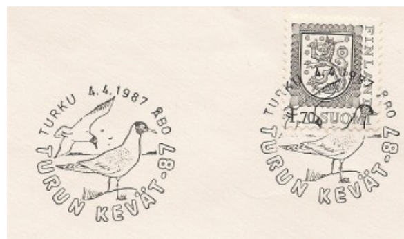
Afb. 7 (Voorjaar in Turku)