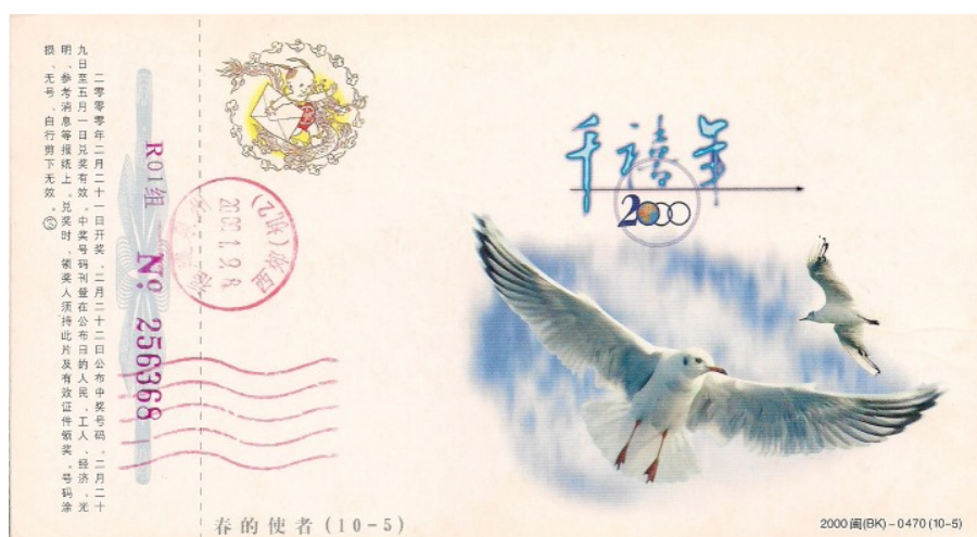
Afb. 4 (Chinees postwaardestuk)

vlekjes over. Achter elk oog één met een dun streepje over de kop. Het lijkt dan net of ze een koptelefoontje dragen (afb. 4). Jonge vogels zijn hebben veel bruin op de vleugels en ook poten en snavel zijn dan nog niet op kleur. Ze zijn overigens veel minder bruin dan de jongen van andere meeuwensoorten. De witte staart met