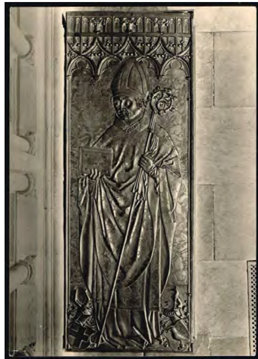
Afbeelding 5a: prentbriefkaart uit 1924 waarop de dekplaat van de sarcofaag van de in 1514 overleden bisschop

Tot zover de sage, maar aan de historische juistheid ervan kan, terecht, worden getwijfeld. Dat blijkt overduidelijk uit het laatste deel van de oud-Duitse tekst (Afb. 3). Er is namelijk, behalve dit verhaal, in de hele geschiedschrijving uit die tijd niets terug te vinden over het voorval. Daarnaast schijnt bisschop Thilo von Trotha een bijzonder aimabel mens geweest te zijn, die zichzelf uitstekend wist te beheersen en tot zulk gedrag eigenlijk niet in staat moet