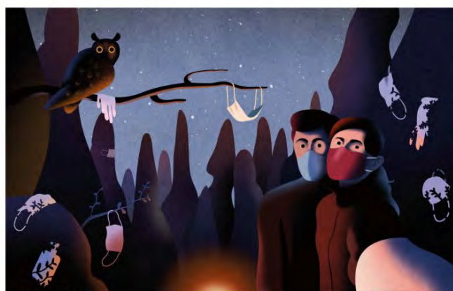
PICOS DE EUROPA