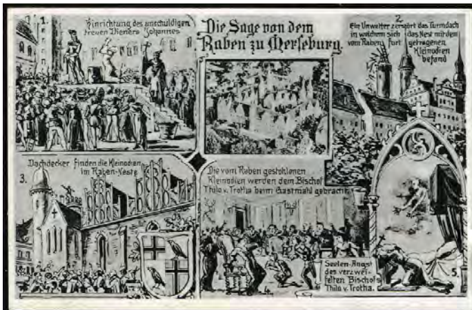
Afbeelding 6: prentbriefkaart, postaal gebruikt op 4-4-1952