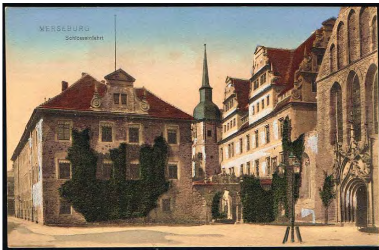
Afbeelding 2: prentbriefkaart uit 1905 (ongebruikt)

twee raven. Dat maakte ons – uiteraard - nieuwsgierig en even later vonden wij een plaatje met daarop in oud-Duits de verklaring (Afb. 3). De tekst hierop is, mede door de verwerking, wat lastig te lezen, maar op de bijgaande prentbriefkaart (Afb. 4) staat in grote lijnen hetzelfde verhaal in hedendaags Duits; tevens is de bewuste kooi hierop twee keer afgebeeld. Voor degenen die het Duits niet machtig zijn volgt hieronder de vertaling.