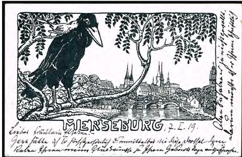
Afbeelding 1: prentbriefkaart, postaal gebruikt op 8-1-1919

Het is al meer dan duizend jaar oud (voor het eerst genoemd in 830) en sinds het jaar 968 bisschopsstad. Uiteraard bekeken wij de domkerk en de restanten van de voormalige stadsmuren. Het slot van de vroegere bisschoppen was helaas alleen aan de buitenkant te bezichtigen (Afb. 2). Op het plein voor het slot troffen wij een grote kooi aan met daarin