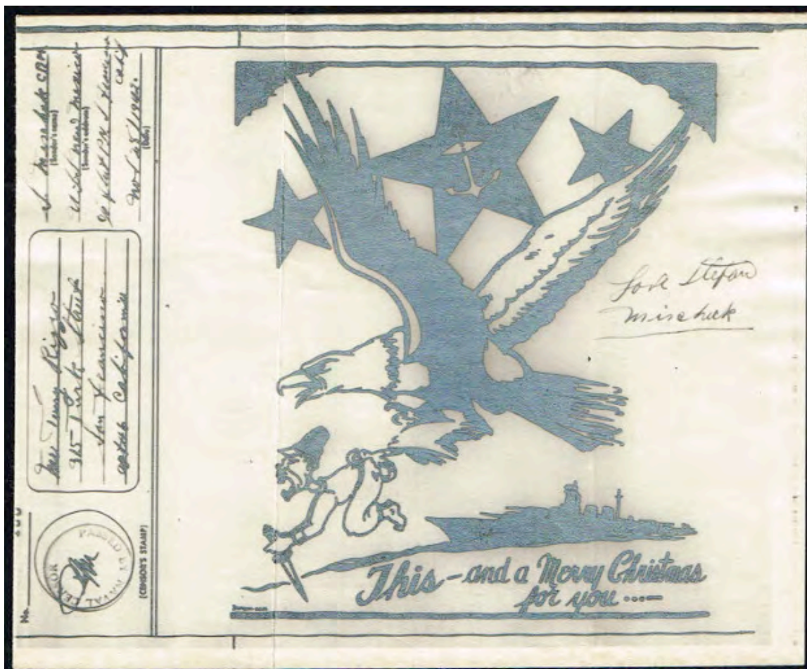
Amerikaanse zeearend met een lekker hapje (ziet er uit als een Japje)

Amerikaanse V-Mail (Victory-Mail): dit was een luchtpostdienst die door het Amerikaanse leger werd toegepast tijdens de Tweede Wereldoorlog. Post van en naar dienstdoende militairen werd op microfilm vastgelegd en op de plaats van bestemming afgedrukt, in een envelop gestoken en verzonden. Het voordeel bestond hierin dat er slechts microfilms verzonden hoefden te worden in plaats van een grote hoeveelheid post in postzakken.