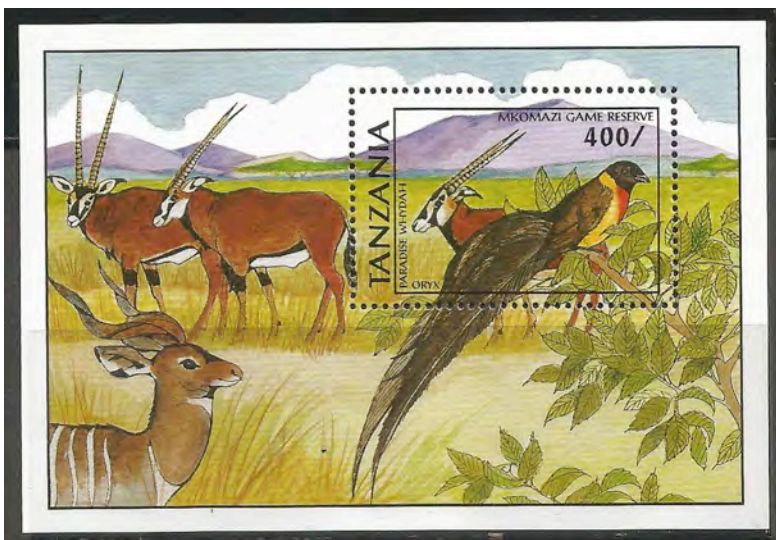
(3) Vidua paradisaea

polygamie ook broedparasitisme, met als 'slachtoffers' prachtvinken. Deze pleegouders behoren tot de prachtvink-families Pytilia, Estrilda, Uraeginthus en Lagonosticta. De vrouwtjes van de Weduwevogels leggen hun eieren in de nesten van deze vogels en bekommeren zich niet om de broedzorg en het groot brengen van de jongen. Elk vrouwtje legt slechts een ei in het nest van de pleegouders.