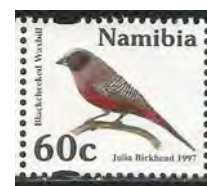
(9) Estrilda erythronotos , Elfenastrilde

Waardvogel: Estrilda erythronotos , Elfenastrilde (9)