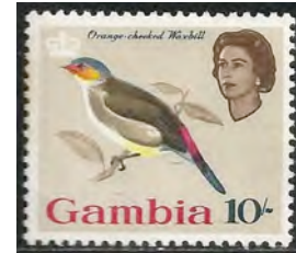
(15) Astrilda melpoda , Goudbuikje

Waardvogels: Astrilda melpoda , Goudbuikje(15).