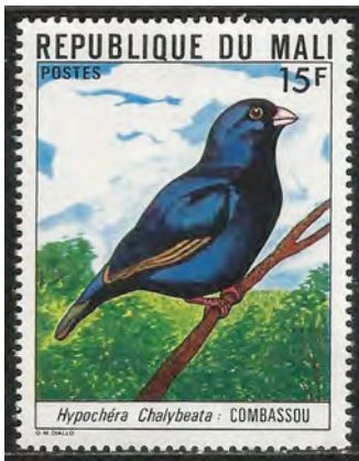
(1)(5) Vidua chalybeata , Staalvink

Afrikaanse Weduwevogels zijn in rustkleed eenvoudig getekende vogels zonder versieringen. Bij de vogels met in de Nederlandse naam wida hebben de mannetjes in het prachtkleed 4 sterk verlengde middelste staartpenen. De twee middelste staartpenen zijn ook extra breed. Doordat de sierveren om de lengte- as zijn gedraaid, wrijven ze bij het opvliegen tegen elkaar. De veren maken daardoor een snorrend geluid. De verlengde middelste staartpenen zijn metaalachtig zwart, de hals, nek, buik of borst hebben al of niet uitgebreide rode of gele veerpartijen. De mannetjes bakenen hun territorium af met baltsvluchten. De totale lengte van de vogels is 15 cm. maar in de voortplantingstijd zijn de mannetjes met hun verlengde staartpenen 40 cm. Ze geven de vogels ook een sierlijk aanzien. Buiten de broedtijd is het verenkleed van de mannetjes en vrouwtjes bruinachtig van kleur met een musachtige streping. De Staal (1) of Atlasvinken hebben geen verlengde staartpenen in het broedseizoen. Ze hebben