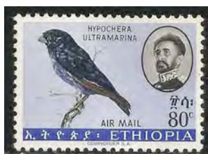
(8) Vidua hypocherina , Langstaartstaalvink,

Waardvogel: Lagonosticta larvata , Zwartmaskerastrilde(10), Lagonosticta rubricata , Donkerrode Amarant (4).