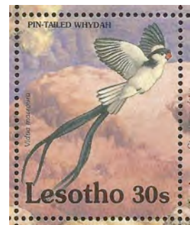
(2) Vidua macroura , Dominicanerwida

De naam Vidue, weduwe, hebben de vogels te danken aan de lange, brede zwarte staartveren die de vroegere onderzoekers deed denken aan afhappende rouwsluiers. Vaak heeft een mannetje verschillende vrouwtjes. Weduwevogels kennen naast deze