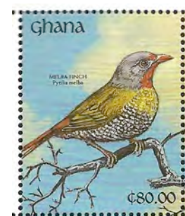
(13) Pytilia melba , Melba astrilde

Waardvogel: Pytilia melba , Melba astrilde (13)