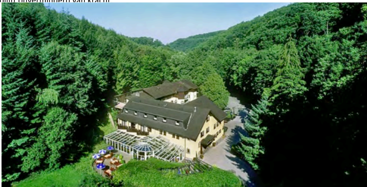
Hotel Brandhof in Seeheim

Mijn stelling in Cb104, dat er voor Nederlanders en Belgen niets noemenswaardigs zal veranderen, blijft onverminderd van kracht