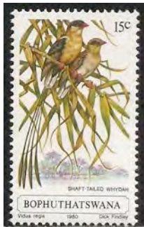
(16) Vidua regia , Konigswida

Vidua regia , Konigswida(16), Königswitwe(D)