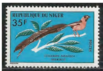
(12) Vidua orientalis , Sahelparadijswida,

Waardvogel: Pytilia afra , Wienerastrilde,