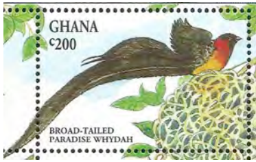
(14) Vidua paradisaea , smalstaartparadijswida

De mannetjes zijn in de broedtijd zwart op de kop, keel, mantel, rug en staart. Ze hebben een goudgele kraag en op de borst en buik zijn ze geelachtig.