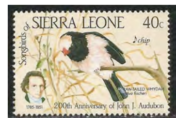
(7) Vidua fisheri , Fischers wida

Waardvogels: Uraeginthus granatinus , Granaatastrilde en Uraeginthus ianthinogaster , Purper ganaatastrilde.