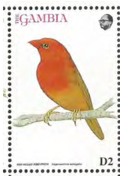
(6) Lagonosticta senegala , Vuurvink