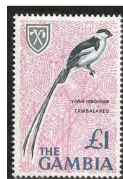
(11) Vidua macoura , Dominicanerwida

Waardvogel: Lagonosticta larvata , Zwartmaskerastrilde (10), Lagonosticta rubricata , Donkerrode Amarant (4).