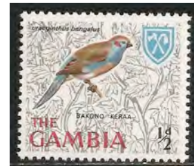
(17) Uraeginthus bengalus , Blauwfazantje

Waardvogels, Uraeginthus bengalus , Blauwfazantje (17) en Uraeginthus granatinus , Granaatastrilden