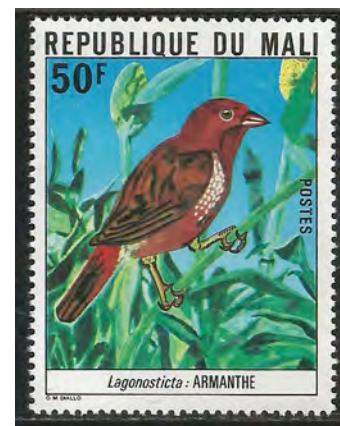
(4) Lagonosticta rubricata , Donkerrode amarant

Waardvogels: Clytospiza monteiri, Druppelastrilde, Euschistospiza dybowskii, Dybowski astrilde, Lagonosticta rara, Zwartbuikamarant, Lagonosticta rubricata, Donkerrode amarant (4).